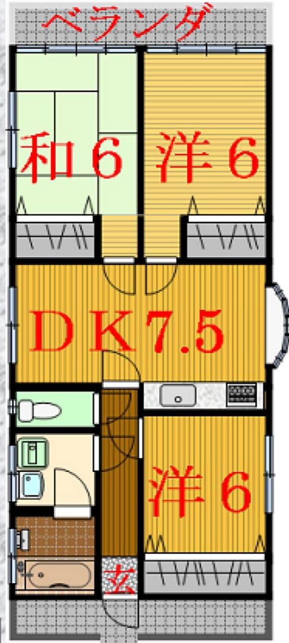
↑松健案内図・物件間取図(現況優先)裏